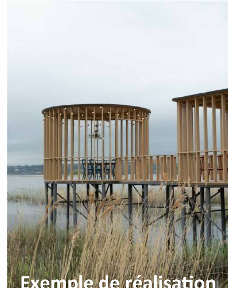
Exemple de réalisation